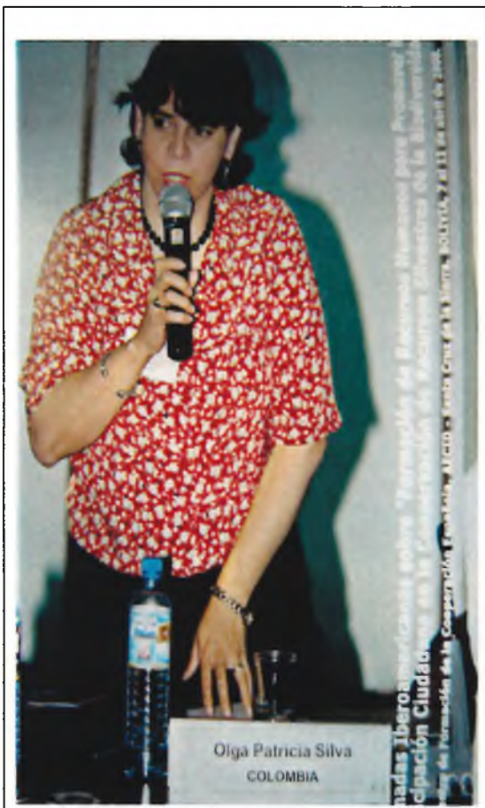
Presentación Inicio Jornada